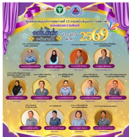
ขอแสดงความยินดีกับ อสม. ทุกท่าน ในการคัดเลือกเป็นอาสาสมัครสาธารณสุขประจำหมู่บ้าน (อสม.) ดีเด่น ระดับชาติ ประจำปี พ.ศ. 2569